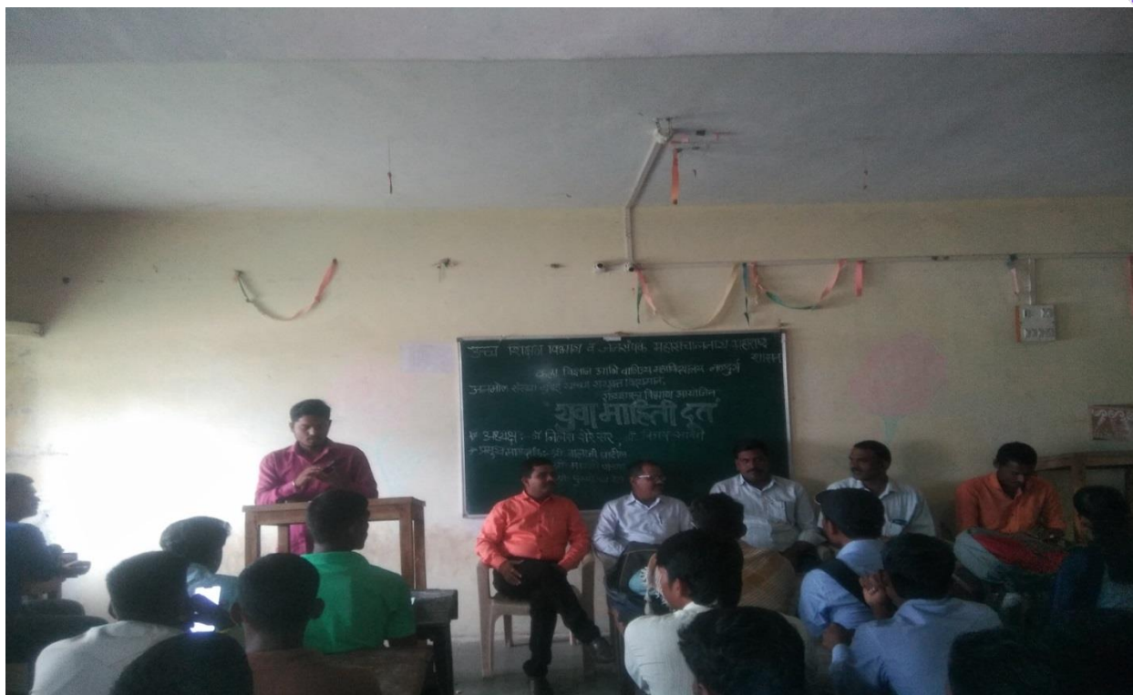
Department of Higher Education and Directorate General of Public Relations, Government of Maharashtra, Department of Political Science, Arts, Science and Commerce, College Naldurg and Anmol Social Organization, Mumbai jointly inaugurated the Youth Information Messenger.