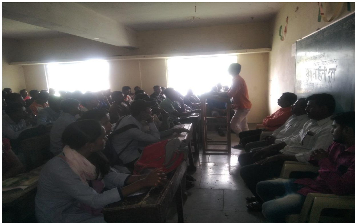
The dignitaries and students present at the event.